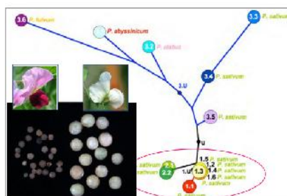
planý kulturní hrách