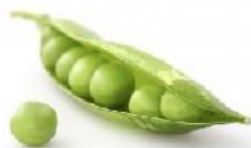
Petr Smýkal, UPOL